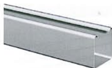
25 x 24 mm

Die formschöne Oberschiene ist besonders geeignet für die Lamellenbreiten 16 und 25 mm. Mit ihr lassen sich alle Bedienungsarten kombinieren – von manuell bis elektrisch (24-Volt-Antrieb).