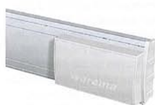
37 x 25 x 24 mm

Die Oberschiene (37 x 25 x 24 mm) bietet die eleganteste Form der Montage in den Fensterflügel (Glasleisten-Jalousie). Es wird eine saubere und einfache Montage ermöglicht.