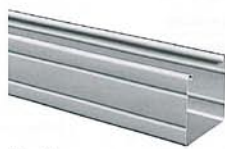
40 x 36 mm

Die solide Oberschiene in der Abmessung 40 x 36 mm bietet sich besonders für große Jalousien (Breite bis 4000 mm, Höhe bis 3000 mm) an. Die elektrische Variante wird hier durch einen 230-Volt-Motor realisiert.