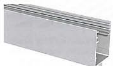
28 x 34 mm

Auch bei der Oberschiene Typ 2 sind alle Bedienelemente für den Einbau in Verbundfenster und Raumtrennsysteme möglich.