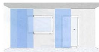
zweiläufige Anlage, Bedienung durch Schleuderstab, mit 3 Stoffpaneelen – frei verschiebbar