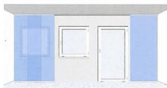
dreiläufige Anlage, Bedienung durch Schleuderstab, mit 3 Stoffpaneelen – frei verschiebbar

WAREMA Flächenvorhänge sind ein einfaches, aber wirkungsvolles Gestaltungsmittel. Die vielfältigen Möglichkeiten, den Behang entsprechend den individuellen Bedürfnissen anzuordnen und zu bedienen, bieten für jede Raumsituation die optimale Lösung. So werden kreativen Wohnideen keine Grenzen gesetzt.