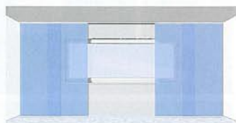
zweiläufige Anlage, Schnurbedienung, mit 4 Stoffpaneelen – Pakete getrennt